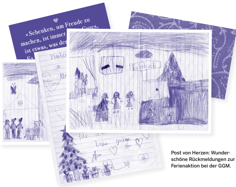
Post von Herzen: Wunder-schöne Rückmeldungen zur Ferienaktion bei der GGM.

Wetter gibt es für die unterschiedlichen Altersgruppen genügend Platz für Indoor-Aktivitäten.