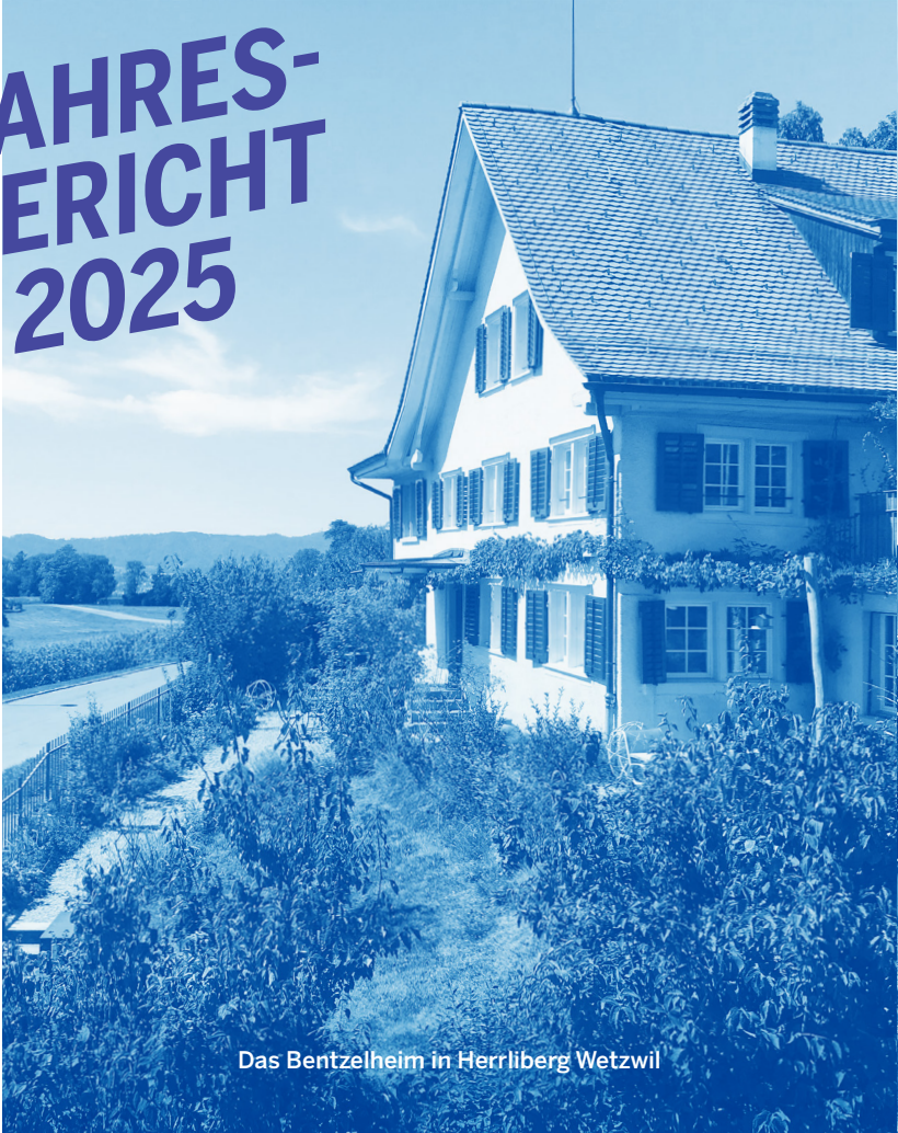
Das Bentzelheim in Herrliberg Wetzwil