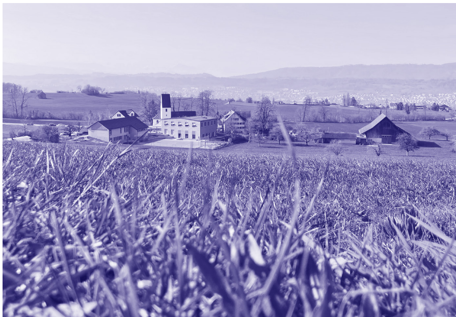
Das historische Ensemble von Wetzwil: Das Bentzelheim mit Kirche, Schulhaus und Scheune inmitten von Weide- und Ackerland.